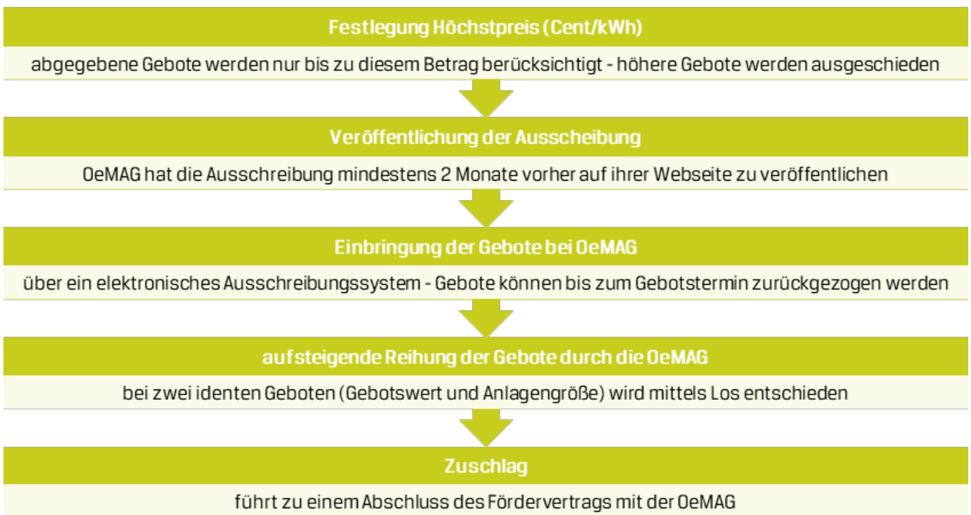
Abbildung 2: Beschreibung der Ausschreibung