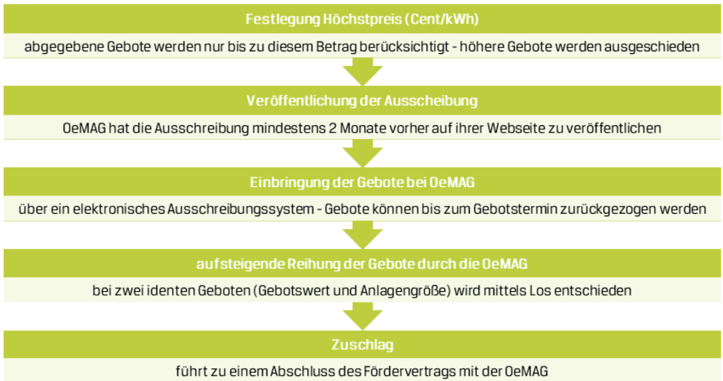
Abbildung 2: Beschreibung der Ausschreibung